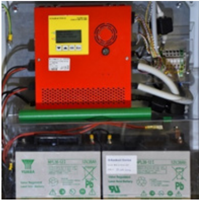
AT-M mit 2 Batterien NPL38-12i